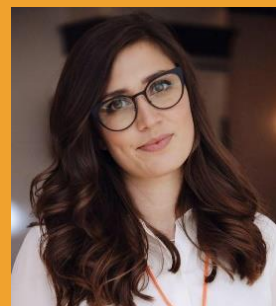
Руководитель молодежных проектов