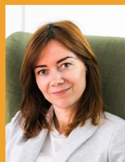
Менеджер по орг. мероприятий